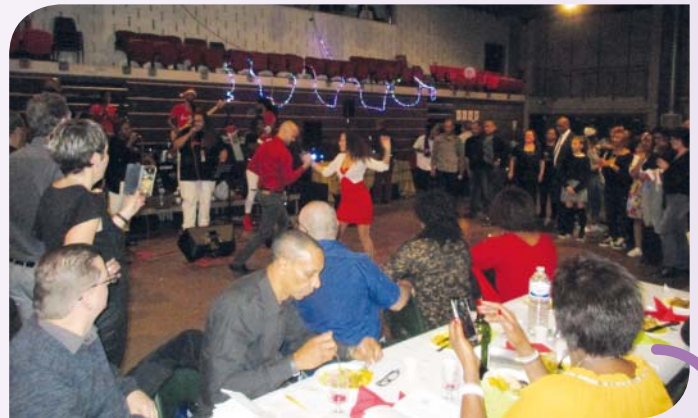
Le Nwel Kreyol de l'association Echanges culturels antillais métropolitains (Ecam) bat son plein le 15 décembre à l'Espace Germinal. Après avoir chanté Noël, on se régale et on danse jusqu'au bout de la nuit.