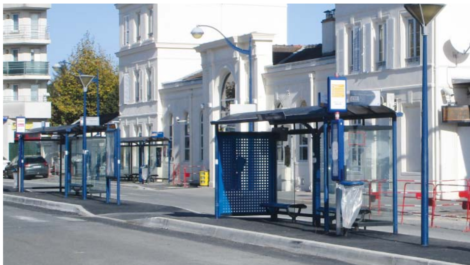
→ En novembre 2018, les quais de bus de la gare routière (entre autres) ont été rénovés pour être accessibles aux PMR.

Même si les travaux eux-mêmes créent des problèmes de circulations et de stationnements, les nouveaux aménagements de la ville sont tous pensés et réalisés afin d'être accessibles. L'ensemble du cœur de ville le sera bientôt grâce à la rénovation urbaine ! Les nouveaux équipements comme l'hôtel de ville et le restaurant intergénérationnel sont adaptés aux contraintes liées au handicap.