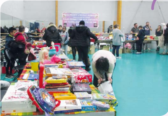
La Brocante des Recyc'lutins dans la salle de danse du gymnase Cathy Fleury samedi. Chaque exposant a donné un jeu ou un jouet au Secours Populaire en échange du stand. Ils ont été remis à l'association par le maire en fin d'après-midi.