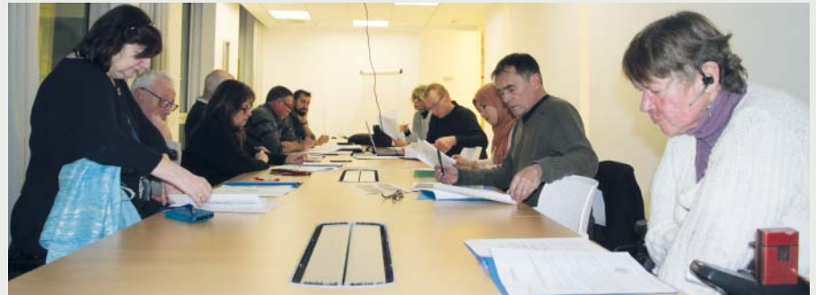
→ La Commission communale d'accessibilité en réunion le 19 décembre 2018 en mairie.