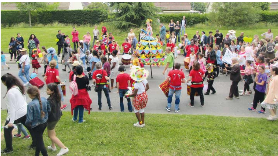
→ Fête de la ville en 2018

Comme chaque année, la ville et ses partenaires vous proposent de nombreux temps forts. En 2019 deux anniversaires importants seront célébrés : les 10 ans de l'ORU en mars et les 30 ans de la découverte du passé potier de Fosses en juin. Tous à vos agendas pour noter les événements du premier semestre !