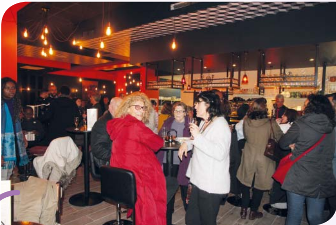
Le 3 décembre, beaucoup de monde à l'inauguration du restaurant Foss' Brasserie. Un lieu magnifique de l'avis de tous !