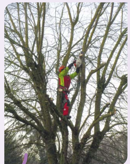
Trois tilleuls élagués autour du monument aux Morts pour la France, Grande-Rue au village.