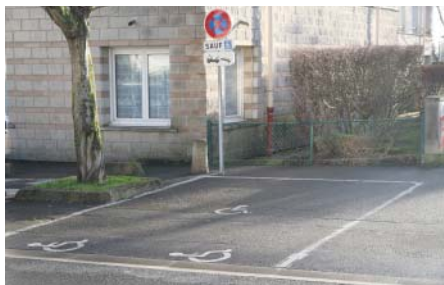
→ Une des 29 places réservées aux PMR dans le centre ville de Fosses

Faciliter les déplacements, mieux accueillir, sont les objectifs premiers de la démarche d'accessibilité. Par exemple, entre le cœur de ville et la gare 13 places de parking pour personnes à mobilité réduite ont vu le jour.