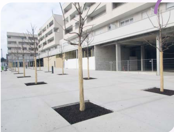
Vingt paulownias plantés en décembre, sur la dernière partie aménagée de la grande place du 19-Mars-1962.