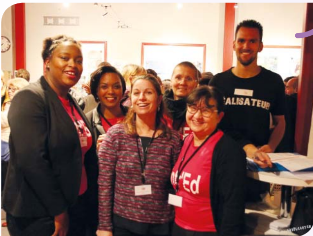
Les bénévoles d'Entr'Ed se réjouissent de recevoir un public nombreux au ciné-débat du 11 décembre autour du documentaire « Ma Dysjérence ».