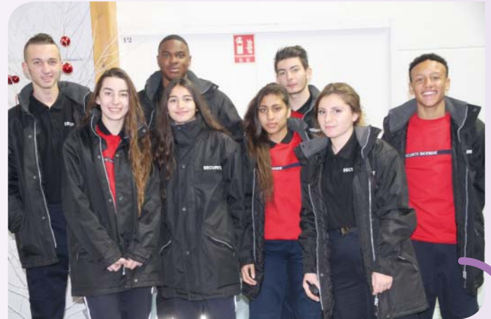
Plan Vigipirate oblige, une inspection visuelle des sacs a été mise en place à l'entrée du gymnase Cathy Fleury. Elle a été assurée très professionnellement le samedi par les élèves en bac pro Métiers de la sécurité du lycée Baudelaire. Ci-dessus une partie des lycéens mobilisés sur ce marché de Noël. Merci à tous !